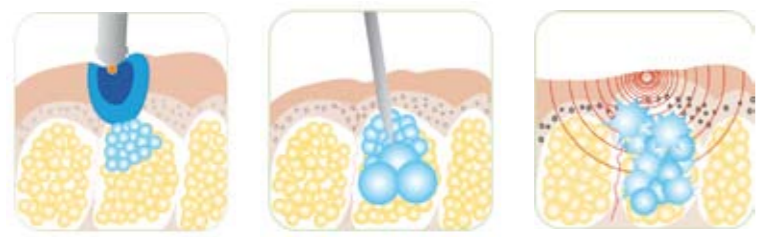
CRYOTHÉRAPIE INJECTION SONODERMIE